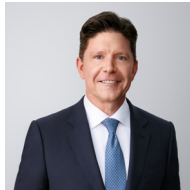
Bob Mauch Predsjednik i glavni izvršni direktor

Kako Cencora raste kao globalna organizacija, tako nastavlja rasti i naša kolektivna odgovornost da se ponašamo i poslujemo etički i pošteno. U isto vrijeme, usklađivanje postaje sve složenije kako se razvijaju i zakoni, propisi i politike kojih se moramo pridržavati. Zato je od vitalne važnosti da svaki član tima odvoji vrijeme kako bi pomno pregledao ovogodišnji Kodeks etike i poslovnog ponašanja i ponovno se obvezao na poštivanje Kodeksa kao dijela naše kulture usklađenosti.